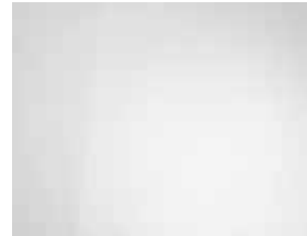
Atlas White (Uni) 1