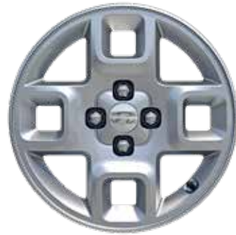
5,5 J x 15-Zoll-Leichtmetallfelgen mit 185/65 R 15 Bereifung