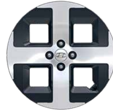
6,5 J x 17-Zoll-Leichtmetallfelgen mit 205/45 R 17 Bereifung 2