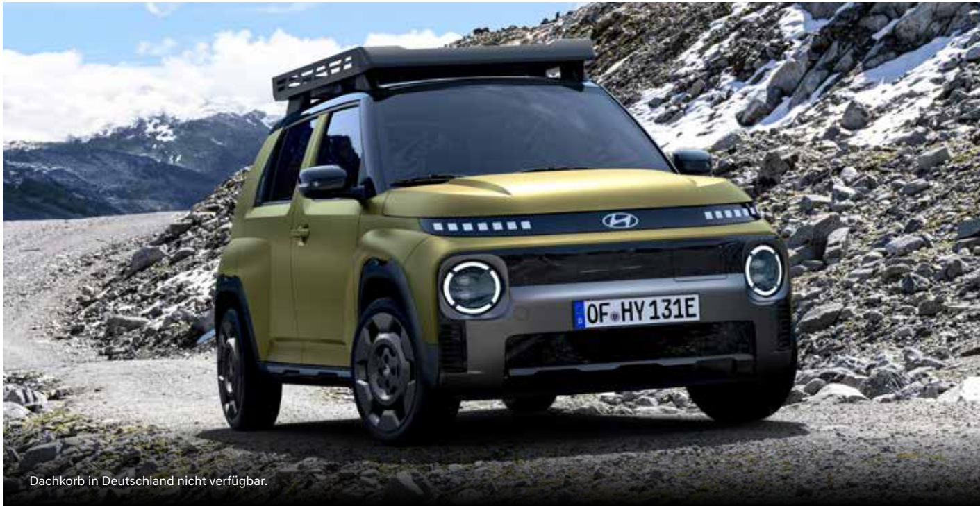
Dachkorb in Deutschland nicht verfügbar.