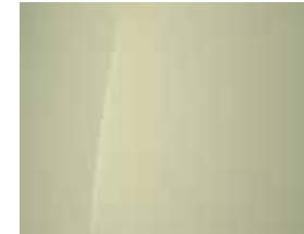
Buttercream Yellow (Mineraleffekt) 1