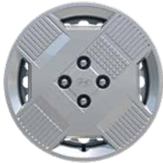
5,5 J x 15-Zoll-Stahlfelgen mit Radzierblende und 185/65 R 15 Bereifung

Jetzt Ihren Hyundai INSTER konfigurieren.