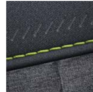
Sitzpolsterung in Stoff Dunkelgrau mit limonengelben Applikationen 3