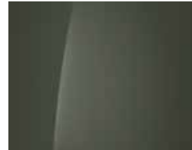
Tomboy Khaki (Uni) 1