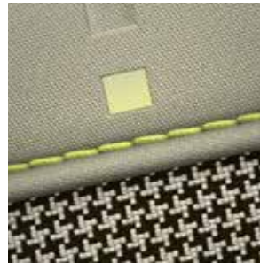
Sitzpolsterung in Stoff Khaki Braun 2