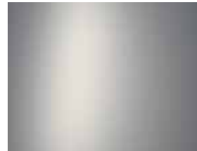
Aero Silver (Matt) 1