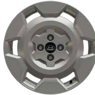
6,5 J x 17-Zoll-Leichtmetallfelgen mit 205/45 R 17 Bereifung 1