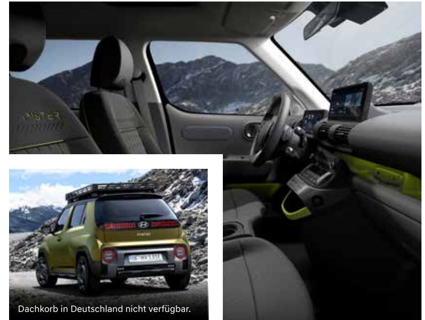
Dachkorb in Deutschland nicht verfügbar.

Als vollelektrisches Fahrzeug bietet der Hyundai INSTER Cross ein Höchstmaß an Komfort, kombiniert mit innovativen Assistenz- und Sicherheitssystemen. Dank der Vehicle-to-Load Funktion (V2L) lassen sich Geräte auch abseits der Stadt problemlos mit Strom versorgen – sei es zum Aufladen von Drohnen oder für die Nutzung von Campingausrüstung. Moderne Fahrassistenz- und Sicherheitssysteme wie Spurhalteassistent, adaptive Geschwindigkeitsregelung und eine serienmäßige Rückfahrkamera sorgen für Sicherheit und Fahrspaß. Mit diesen Technologien wird der Hyundai INSTER Cross nicht nur auf der Straße zum zuverlässigen Begleiter, sondern glänzt auch bei vielfältigen Outdoor-Abenteuern.