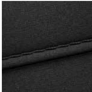
Sitzpolsterung in Stoff Schwarz 1

Jetzt Ihren Hyundai INSTER konfigurieren.