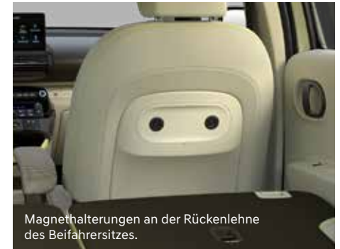
Magnethalterungen an der Rückenlehne des Beifahrersitzes.