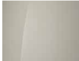
Unbleached Ivory (Uni)

Jetzt Ihren Hyundai INSTER konfigurieren.